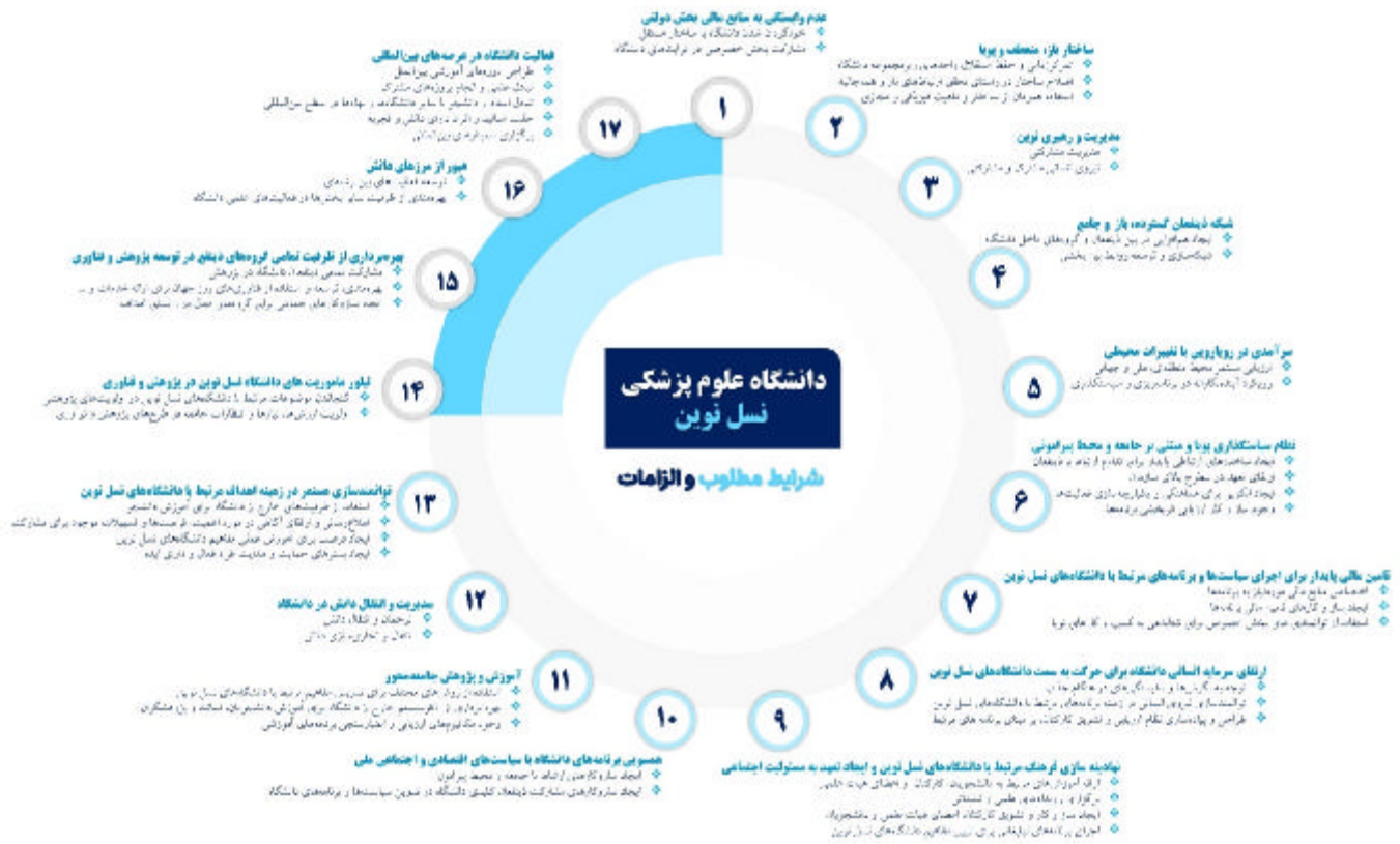
شکل شماره ۲- شرایط مطلوب و الزامات دانشگاه‌های علوم پزشکی نسل نوین

برخوردار باشد (40). بدین منظور تعهد مدیران ارشد سازمان (41)، ایجاد مسیرهای ارتباطی پایدار با ذینفعان (42)، وحدت رویه و نظام همکاری درون بخشی و ارزیابی مستمر سیاست‌های دانشگاه از الزامات دستیابی به این هدف می‌باشد. لذا برای اجرای موفق برنامه‌های مرتبط با دانشگاه‌های نسل نوین، ضروری است تا ساختار یکپارچه‌ای، متشکل از تمامی بخش‌های مرتبط با اجرای این برنامه‌ها، ایجاد و با تدوین رویه‌ای یکسان برای اجرای برنامه‌ها و پیگیری آن در داخل و خارج از دانشگاه، بسترهای اجرای موفق برنامه‌ها فراهم گردد (43). همچنین ضروری است تا ساز و کار ارزیابی اثربخشی