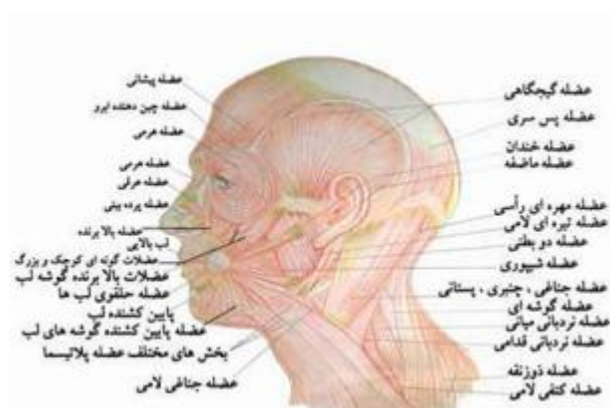
تصویر شماره ۲- انواع عضلات سر و صورت

نوع عضلات، شرکت در حرکات بدن است. انقباض این عضلات، سریع و قدرتمند است و معمولاً، تحت کنترل ارادی اند (۴۸). هر یک از عضلات اسکلتی، به تناسب جایگاه یا کارکردی که دارند، عنوانی خاص گرفته‌اند. در تصویر زیر، انواع عضلات سر و صورت، با عناوین خاص آن‌ها، دیده می‌شود؛ البته در این تصویر، برخی از عضلات گردن نیز، نمایش داده شده‌اند. عضلات گردن، بستر اصلی شجاج نیستند و مشمول عضلات سر و صورت نمی‌شوند: