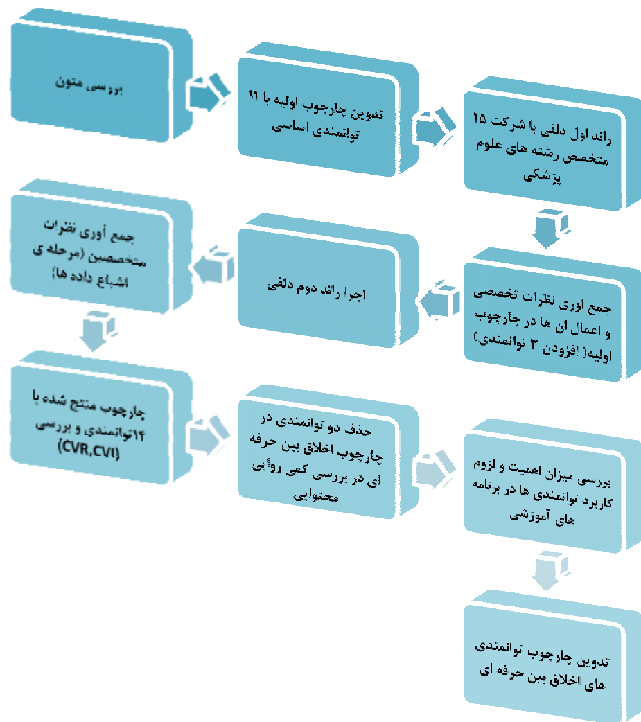
نمودار شماره ۱ - مراحل اجرایی مطالعه

در نهایت، باتوجه به هدف کاربردی مطالعه، نظرات ۲۵ نفر از متخصصان رشته‌های مختلف علوم پزشکی (علوم پایه، علوم بالینی، پرستاری و علوم توانبخشی) در رابطه با میزان