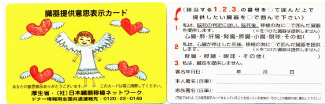
شکل شماره ۱. کارت تصمیم‌گیری در مورد اهدای عضو

روند قانون‌گذاری در پیوند اعضا سیر طولانی را پشت سر گذاشته است. اولین قانون پیوند اعضا تحت عنوان «قانون پیوند قرنیه» در سال ۱۹۵۸ میلادی به تصویب رسید و سپس در سال ۱۹۷۹ به قانون «پیوند قرنیه و کلیه» تغییر داده شد