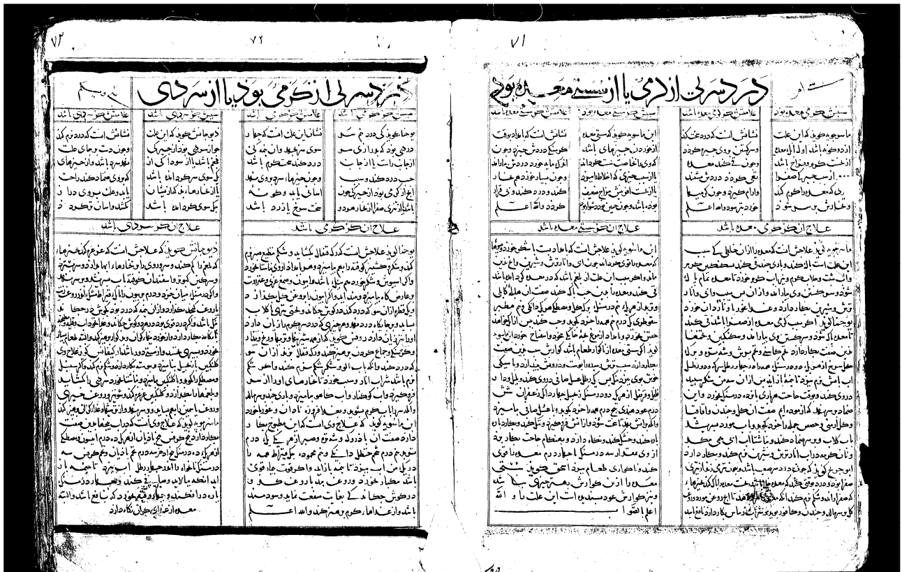
تصویر شماره‌ی ۱ - نمونه‌ی معرفی بیماری‌ها در کفایه الطب

مجسه (نبض‌شناسی)، علایم بیماری و بهبودی، دانستن حال و هوای شهرها و گردش چهار فصل بیان شده است. متن اصلی کتاب اول که در مورد شناخت بیماری‌هاست در داخل جداولی ارائه شده است که سه بخش دارند: سبب، علامت و علاج بیماری. هر صفحه از کتاب شامل دو جدول است که معمولاً هر دو درباره‌ی یک بیماری توضیح داده است. در بیشتر موارد تفاوت این دو جدول مربوط به عامل بیماری است که یا از گرمی است یا سردی. برای مثال، تب مطبق که از سردی باشد یا از گرمی. گاه تفاوت این دو جدول مربوط به تفاوت دیدگاه دو طبیب در مورد یک بیماری است و گاه