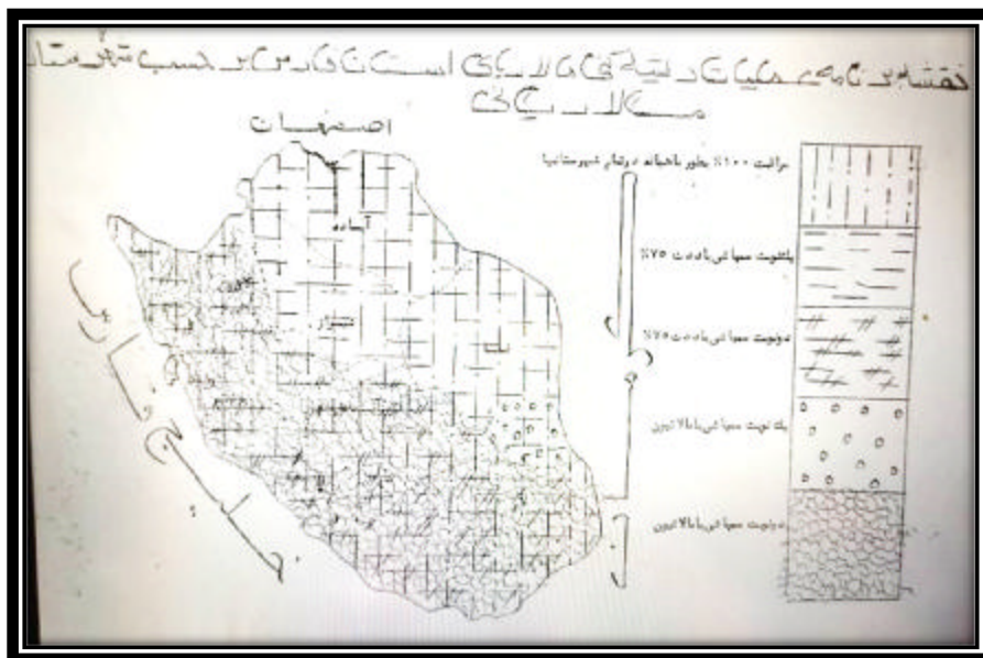
شکل شماره ۱ - نقشه برنامه عملیات ریشه کنی مالاریای استان فارس بر حسب شهرستان مالاریایی (۲۰)

بهداشتی، تجهیزات و تکمیل موسسات و کمک به سازمان‌های بهداشتی بود. ۶۷ درصد اعتبارات بهداشتی به طب پیشگیری و مبارزه با بیماری‌های خطرناک اختصاص یافته بود (۱۶). در برنامه سوم به برنامه‌های اجتماعی بویژه آموزش و بهداشت توسعه روستایی و صنایع روستایی توجه خاصی شد. بنابراین در برنامه سوم به دگرگون شدن وضع زندگی توده‌های مردم توجه کافی شده بود (۱۷) در بازه زمانی اجرای برنامه عمرانی دوم،