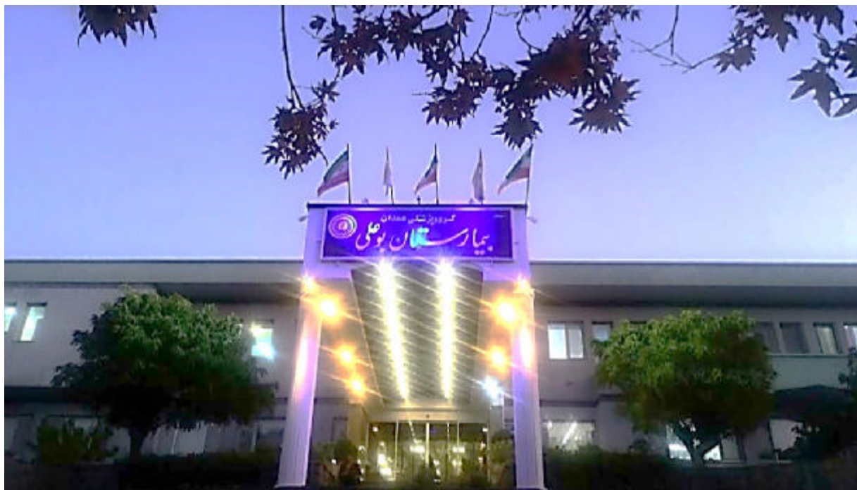
نمای کنونی بیمارستان بوعلی همدان