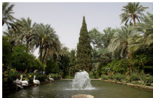
تصویر شماره ۲- باغ گلشن طبس

تحقیقات حاکی از این است که یکی از دلایل گرایش به ایجاد فضاهای دلپذیر، بنانه‌داری باغ‌های دارویی است. یکی از ویژگی‌های بسیار ممتاز دوران اسلامی، باغ‌های دارویی بود. در این دوران، همچنین طرح‌هایی دقیق از گیاهان و گل‌ها