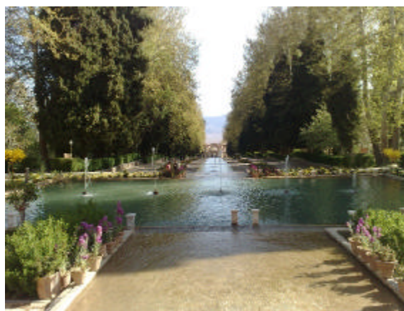
تصویر شماره‌ی ۱- باغ شاهزاده‌ی ماهان