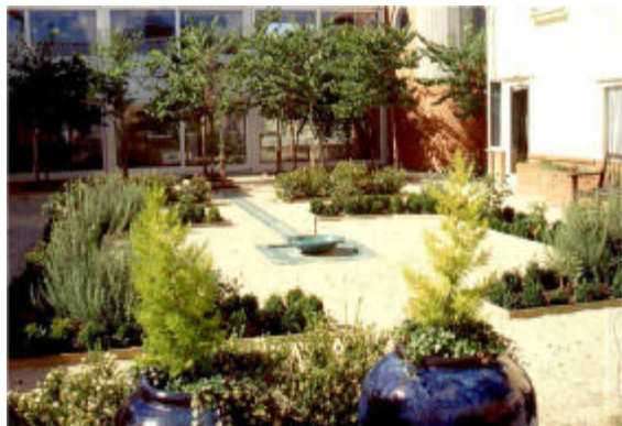
تصویر شماره ۴- استفاده از الگوی باغ ایرانی در طرح محوطه‌ی درمانی مؤسسه‌ی مراقبت از سالمندان در انگلستان