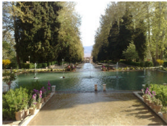
تصویر شماره ۱- باغ شاهزاده‌ی ماهان