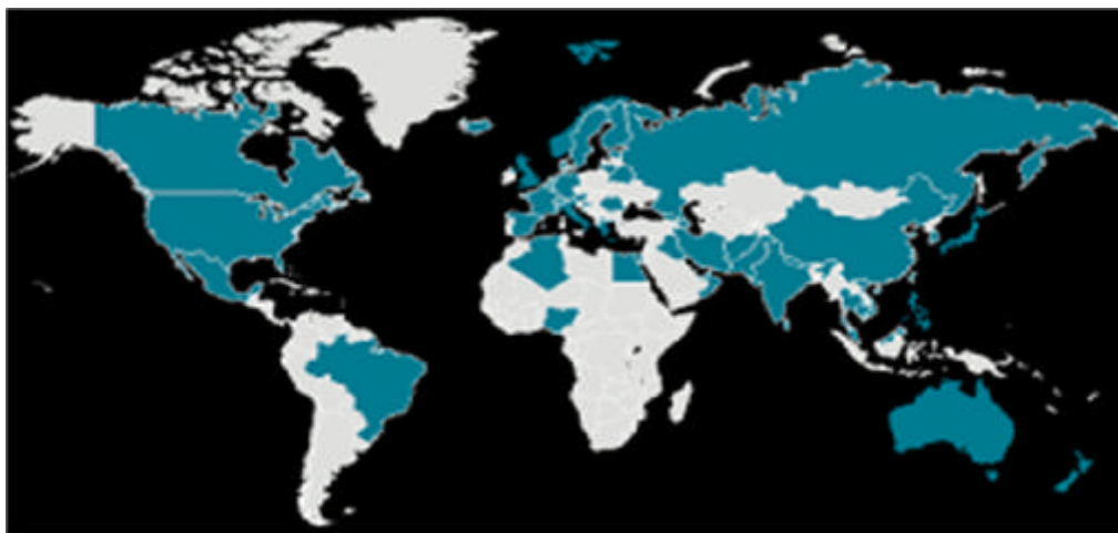
شکل شماره ۱ - میزان درگیری کشورها و مبتلایان به بیماری کووید ۱۹، در مارس ۲۰۲۰ (۱۸)

جهان، با میزان پراکندگی مطابق با شکل شماره ۱ یک، مشاهده شده است و تا این تاریخ، ده کشور نخست از نظر تعداد مبتلایان به بیماری کووید ۱۹، به ترتیب، چین، ایتالیا،