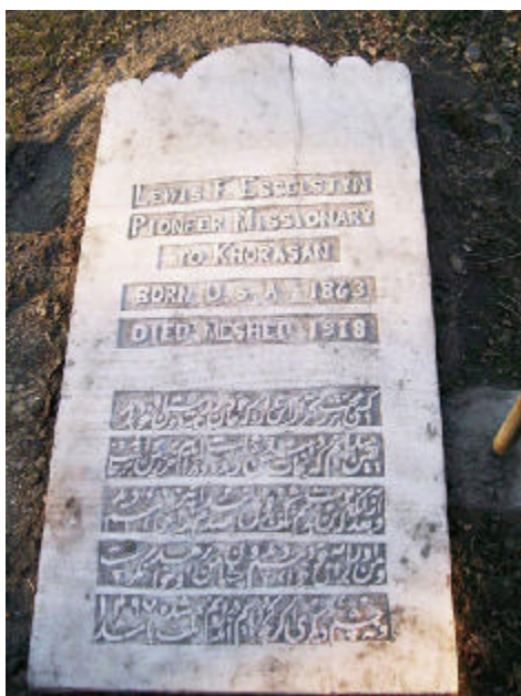
تصویر شماره‌ی ۲- سنگ قبر دکتر لوئیس اسلستین

همچنین، اسلستین مسیونر ۱ آمریکایی، در مشهد، در ۲۱ دسامبر ۱۹۱۸، می‌نویسد: «قحطی در اینجا در حال گسترش است و هر روز، جدی‌تر می‌شود. گندم، اکنون، پوندی ۶۵ تومان است. مردم فقیر در اینجا، به‌شدت، از نظر غذا در رنج‌اند. ما شمار اندکی از آن‌ها را ظهر هر روز، با پولی که برای این کار از سوی دوستان داده شده است، اطعام می‌کنیم» (۱۸). این مسیونر آمریکایی، بعدها، بر اثر بیماری تیفوس یا آنفلوآنزای اسپانیایی، در مشهد، درگذشت (۲۲) (نک: تصویر شماره‌ی دو).