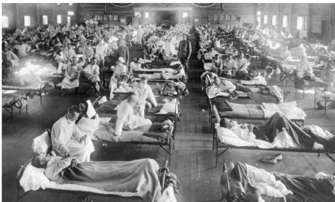
تصویر شماره‌ی ۱- یکی از بیمارستان‌های بیماران آنفلوآنزای اسپانیایی در آمریکا، در سال ۱۹۱۸م. (۳)

مناطق از آسیا، قبل از گسترش سریع در سراسر جهان، مشاهده شد. در آن زمان، هیچ دارو و واکسن مؤثری برای درمان چنین آنفلوآنزای قاتلی وجود نداشت؛ بنابراین، به شهروندان دستور داده شد که از ماسک استفاده کنند. مدارس، تئاترها و مشاغل نیز، تعطیل و اجساد، قبل از پایان جولان مرگ‌بار جهانی ویروس، جمع‌آوری شدند (۲و۱) (نک: تصویر شماره‌ی یک).