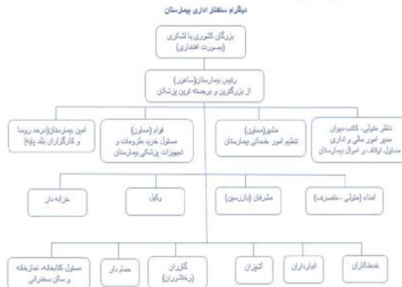
شکل شماره ۱- دیاگرام ساختار اداری بیمارستان

بر عهده داشت؛ لذا در انتخاب این فرد بسیار دقت می‌شد (۲۴). از بررسی و مقایسه‌ی گزارش‌های مربوط به فعالیت ناظر برمی‌آید، وظیفه‌ی اصلی او اداره‌ی اوقاف و اموال بیمارستان‌ها بوده است و به همین علت صاحبان این عنوان را غالباً از میان فقیهان و قاضیان و محتسبان عالی‌رتبه و وکیلان بیت‌المال و متصدیان اوقاف کشور و امرای بزرگ و کاتبان برمی‌گزیدند (۲۵ و ۲۶). گاهی ممکن بود که نظارت بر خزائن دولت و جامع و بیمارستان‌ها در یک شخص تجمیع شود (۲۷)؛ به همین دلیل، با آنکه ناظر بیمارستان را از مناصب دیوانی (کشوری) دانسته‌اند، ولی از اصحاب شمشیر و امرا و اتابکان و حکام (لشکری) هم، به‌عنوان ناظر بیمارستان‌ها یاد کرده‌اند (۲۸). متولی و متصرف گویا بیشتر امور اداری را راه می‌برده و در عزل و نصب کارگزاران دون‌پایه تابع دستورات «ساعور» بوده‌اند (۲۹). از دیگر کارگزاران بیمارستان، شخص «امین» بوده که در بعضی مواقع خود پزشک بوده و منصبی در حد رؤسا یا کارگزاران بلندپایه‌ی بیمارستان داشته (۳) و بعضی اوقات به‌عنوان امانت‌دار بیمارستان، که البته پزشک نبوده، اشتغال داشته است (۱۷). از سایر مدیران و کارکنان