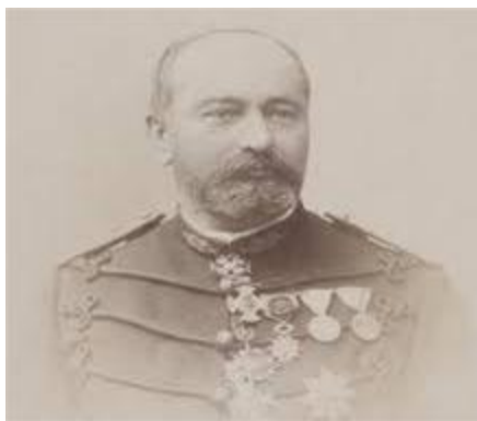
دکتر ژان باتیست فوریه