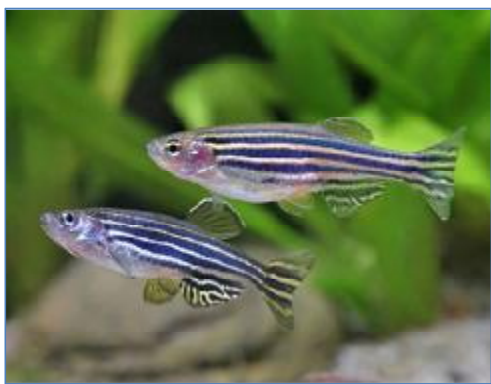
تصویر شماره ۱- ماهی گورخری برگرفته از

شیرین جهان دارد و به خوبی در صنعت آکواریوم و ماهیان زینتی اقصا نقاط جهان وارد شده است. از این ماهی برای کنترل بیولوژیک پشه در برخی نقاط دنیا (۲۵)، در صنعت آکواریوم و ماهیان زینتی (۲۶) و خصوصاً به عنوان یک گونه زیستی مدل ۶ در توسعه علوم مختلف زیست‌شناسی (۲۷ و ۲۸) استفاده می‌شود. به طور کلی ماهیان گورخری از زمان خروج از تخم (مرحله‌ی هیچ‌شدن یا تخم‌گشایی) تا ۲۱ روز پس از آن مرحله‌ی نوزادی (ماهی نوزاد) ۷ ، از روز بیست و یکم تا نودمین روز مرحله‌ی جوانی (ماهی جوان) ۸ و پس از نود روز مرحله‌ی بلوغ (ماهی بالغ) ۹ را طی می‌کنند (۲۹).