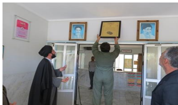
تصویر شماره‌ی ۳- مراسم نصب لوح شافی در بیمارستان

تصویر شماره‌ی ۴- متن تعهدآور نصب‌شده در معرض دید