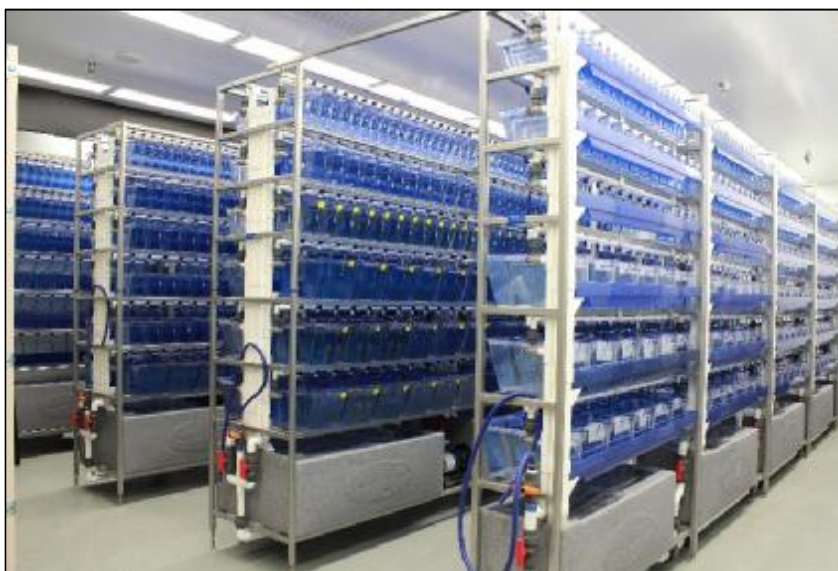
تصویر شماره‌ی ۴- لابراتوار اختصاصی تولید ماهی گورخری دانشگاه دالهاوزی کانادا، آزمایشگاه دکتر برمن.

گورخری، به تولید به‌موقع و مداوم تخم و جنین با کیفیت بالا برای آزمایش بستگی دارد. درک رفتارهای تولید مثلی ماهی در حیات‌وحش و به تبع آن در محیط اسارت، نوآوری‌هایی را در تکنیک‌های پرورش و تجهیز ادوات آزمایشگاهی موجب شده است (۵۰). یک نمونه‌ی شایسته‌ی توجه از این ادوات آزمایشگاهی پیشرفته، استفاده از مخازن تخم‌ریزی iSpawn است که در حال حاضر در کشور وارد نشده اما امکان واردات و حتی تولید آن توسط متخصصان داخلی به‌راحتی ممکن است. این مخازن برای تخم‌ریزی ماهی گورخری طراحی و تولید شده است و امروزه به‌صورت تجاری شده در اقصا نقاط